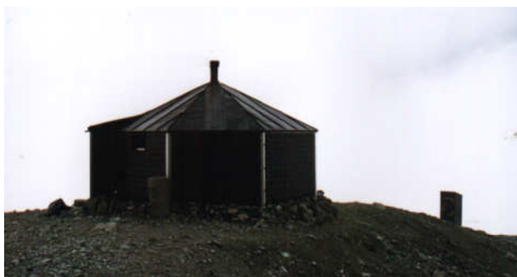
Le Refuge des Bouquetins et ses toilettes

L'unique poêle servant à cuisiner, placé au centre du refuge