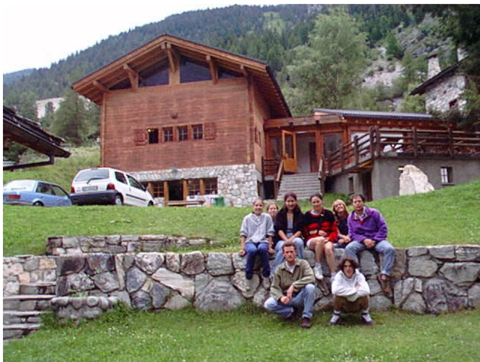
La rédac' de la 1 ère semaine.